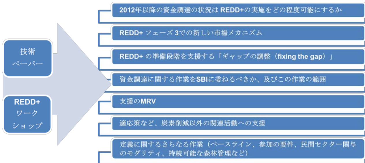
図 3 REDD+ の資金調達に関して COP 18(ドーハ)での決定が予測・期待される要素